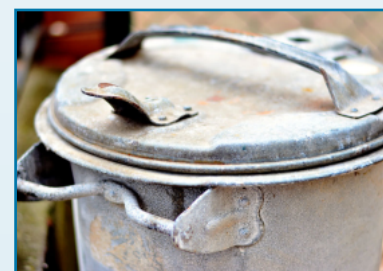
Kvôli nezodpovedným občanom sa zvyšuje poplatok za odvoz komunálneho odpadu