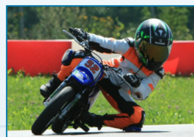
Mladé športové talenty z Ochodnice