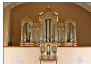
Organ v kostole sv. Martina sa opäť rozozvučal